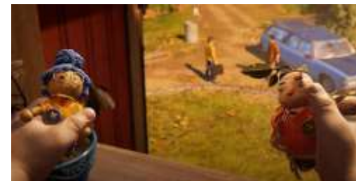
Die Puppen vor der Verwandlung

Ihre Tochter Rose ist zwar wichtig für die Story, taucht während des Spiels aber nicht oft auf.