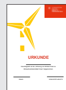
MS_8 KSB Urkunde