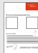
MS_7 KSB Plakat