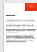
MS_2 Diverse Hintergrundinformationen, Abschnitt 3b