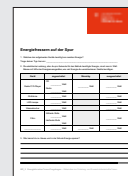
MS_5 Energieforscher*innen, Fragebogen