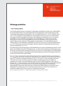
MS_2 Diverse Hintergrund- informationen, Abschnitt 1