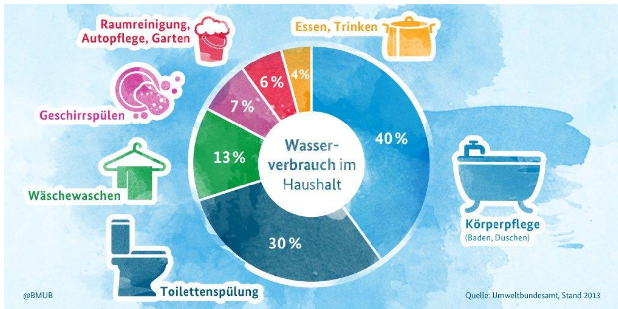
Abbildung 3: Direkter Wasserverbrauch im Haushalt

Beim Wasserfußabdruck eines Landes wird zur Nutzung des heimischen Wasservorkommens der Import von virtuellem Wasser hinzugefügt und davon wiederum der Export von virtuellem Wasser abgezogen. Deutschland hat demzufolge einen Wasserfußabdruck von 117,2 Milliarden Kubikmeter. Länder, die bereits unter Trockenheit leiden, sollten mithilfe dieser Bilanz theoretisch weniger Wasser exportieren. Gerade hier werden aber wasserintensive Produkte wie Reis angebaut, die dann in Industrieländer exportiert werden. Folglich fehlt es den Menschen und der Wirtschaft vor Ort an Wasser und aufgrund von häufig fehlenden Umweltauflagen wird Oberflächen- oder Grundwasser zusätzlich verschmutzt.