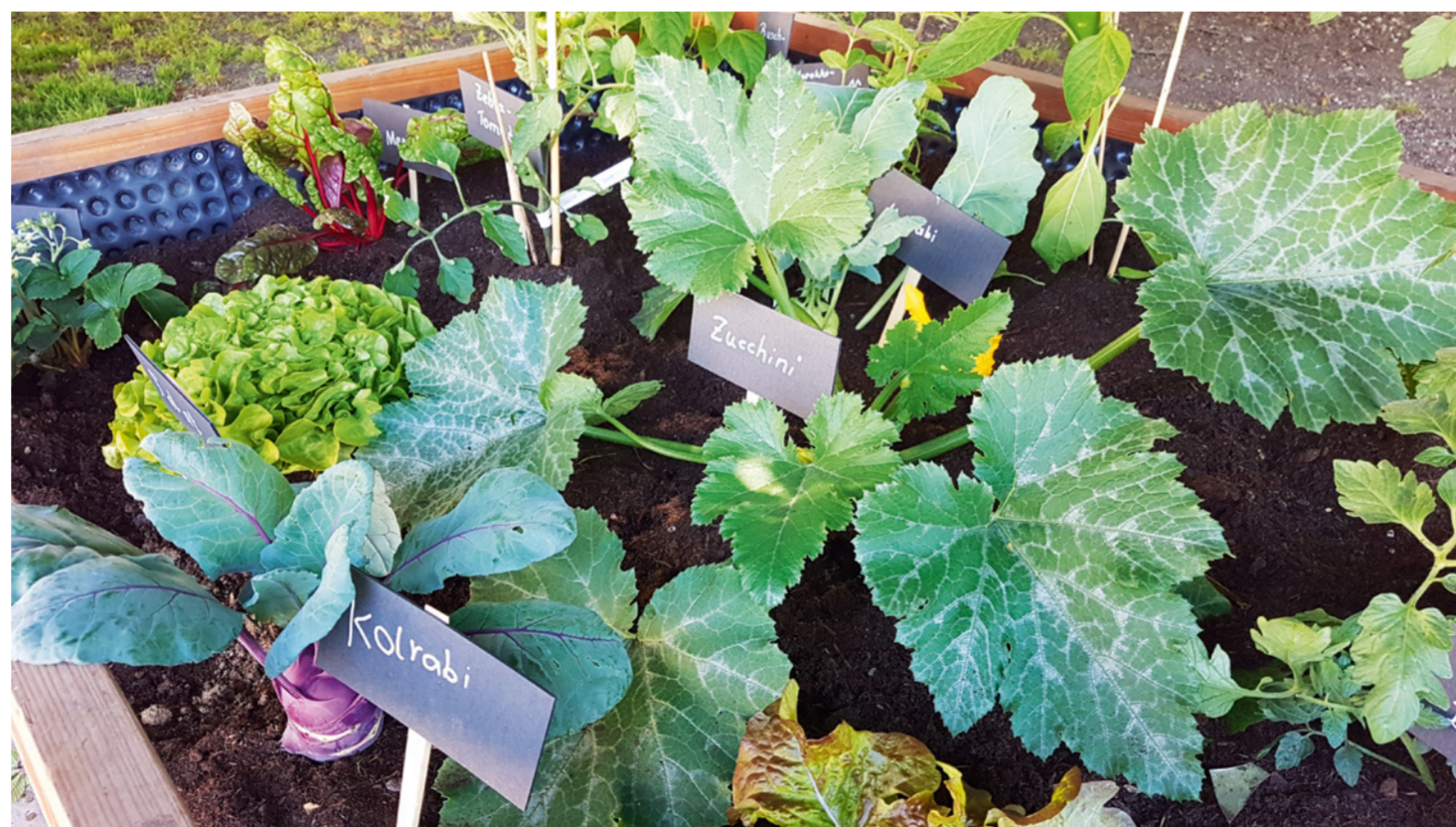
Gemüse im Gemeinschaftsgarten